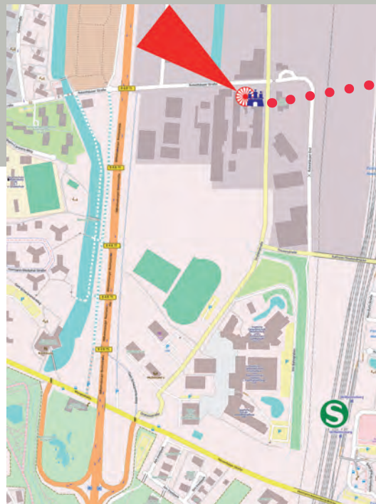
Landesverein der Sinti in Hamburg e.V. Beratungsstelle für Sinti und Roma in Wilhelmsburg

Rotenhäuser Straße 8 21109 Hamburg Tel.: 040 – 57 131 484 Fax: 040 – 57 131 483 beratung@landesverein-hamburg.de www.landesverein-hamburg.de